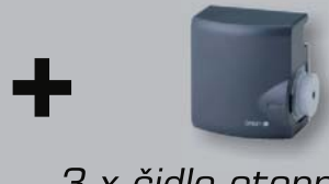
3 x čidlo otopné vody a další příslušenství ...