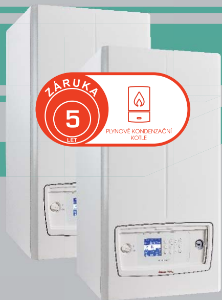
2 x Kondenzační kotel VICTRIX PRO V2 55 EU