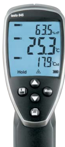
Náhled displeje přístroje s integrovaným vlhkostním modulem: aktuální hodnota relativní vlhkosti, teploty a teploty rosného bodu