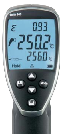
Náhled displeje přístroje při připojení dotykové teplotní sondě: emisivita a aktuální teplota měření infračerveným paprskem a dotykovou sondou