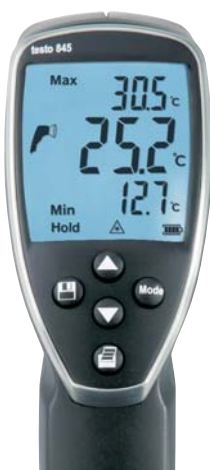
Náhled displeje přístroje při měření infračerveným paprskem: aktuální teplota, hodnota min./max.